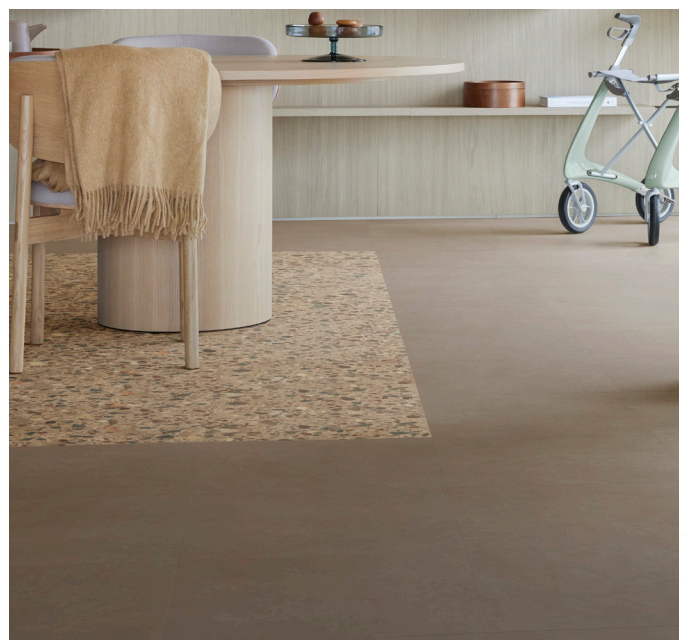
Allura decibel ivory antique oak