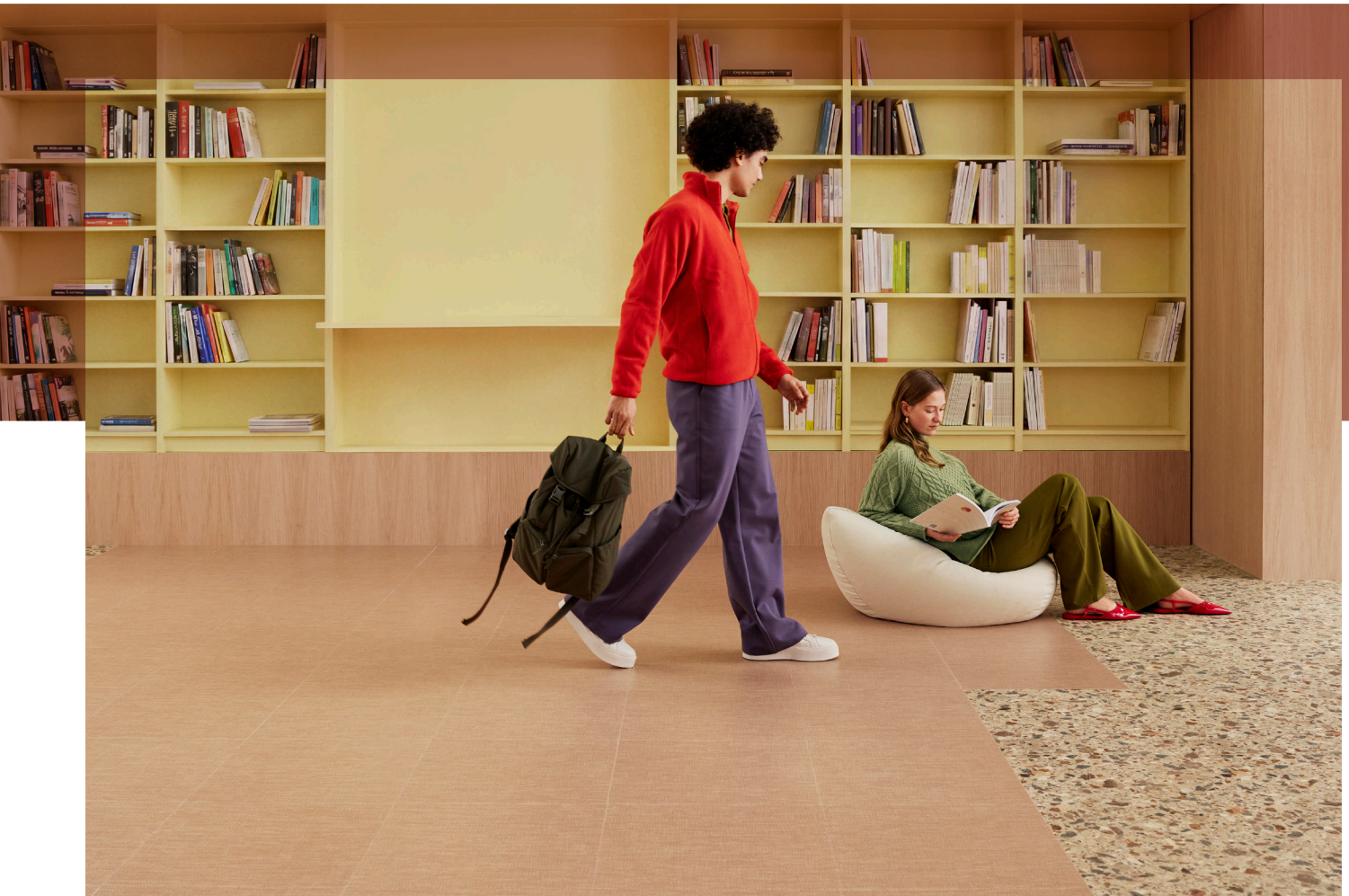
Allura decibel terra terrazzo et peach twill