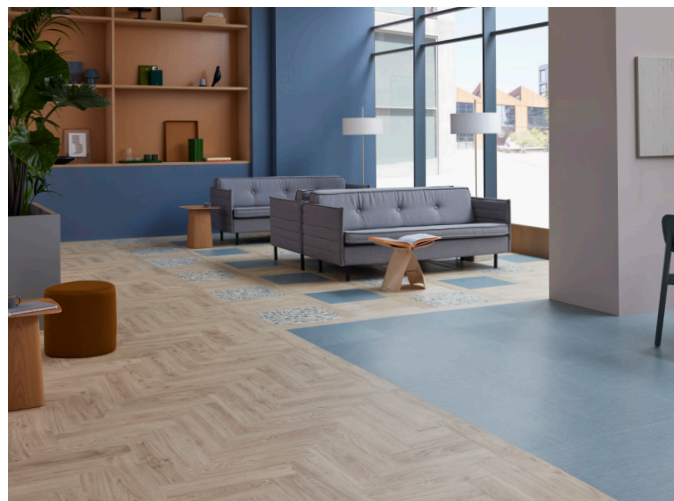
Allura decibel pale authentic oak, blue sky twill et opal terrazzo

Allura Decibel b+ conserve par ailleurs la richesse de formats, effets décoratifs et harmonies chromatiques qui caractérise l'offre, permettant de conjuguer exigence environnementale, durabilité et liberté de conception.