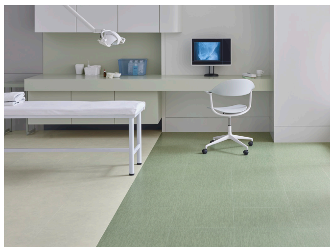
Allura decibel bianco perlino et pistacchio twill