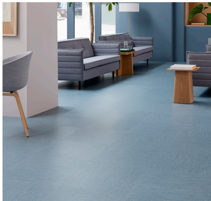
Allura decibel bronze pompeii